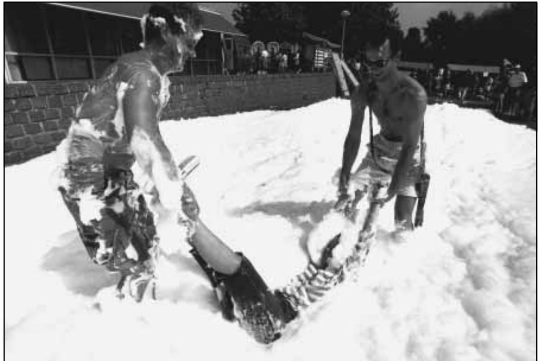
Een eerstejaars student wordt tijdens de sportmarkt op dinsdag wel erg letterlijk in de watten gelegd.