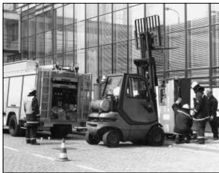
Brandweerlieden ontwerpen het proefapparaat uit de W-hal aan een nadere inspectie.

De brandweer slaagde er al snel in om een einde aan de rookontwikkeling te maken, waarna de lucht in de betreffende ruimte werd ververst. Ook werd het proefapparaat naaar buiten getakeld om daar af te koelen. Na zowat een uur werd de W-hal weer vrijgegeven voor gebruik. Om herhaling te voorkomen heeft de brandweer aangeboden om bij volgende beproevingen voor een goede afzuiginstallatie te zorgen.