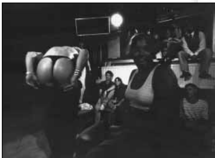
De male-stripper van SSRE toont zich van zijn beste kant.

Vorig jaar werd hij nog bestempeld als een vieze, harige vetklep. Over wie hebben we het? Over de male-stripper die de studentenvereniging SSRE in 1994 inhuurde om de meisjes van de Pré-Intro naar de Bunker te lokken. Dit jaar was gezorgd voor een professional, volgens Ester Smit van SSRE. Volgens haar mocht hij gefilmd en gefotografeerd worden. Het resultaat staat hierbij afgedrukt. Ook verder voltrok de Pré-Intro zich langs de bekende weg: oriëntatietocht, praatcafé, karaoke-show en cabaret van De Bloeiende Maagden. Opmerkelijk was wel het aantal inschrijvingen ervoor; bijna honderd. Meer dan vorig jaar en dat bij een terugloop van het totaal aantal meisjes.