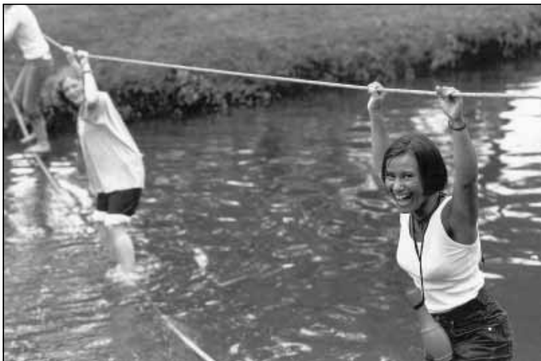
All-Terrain had voor de aankomende eerstejaars studentes een tienkamp georganiseerd, waaronder deze touwbrug.

Vorige week woensdag en donderdag vond traditiegetrouw de Pre-intro plaats. Twee dagen die helemaal gereserveerd zijn voor de aankomende eerstejaars studentes, om hen alvast een voorproef te geven op mannelijke collegae. Blijkbaar een traditie waar behoefte aan is, want maar liefst 118 meisjes hadden zich ingeschreven. Helaas moest DirK, de TUE-vereniging voor vrouwelijke studenten, in het activiteitenprogramma dit jaar verstek laten gaan. Die club werd voor de vakantie juist opgeheven bij gebrek aan belangstelling.