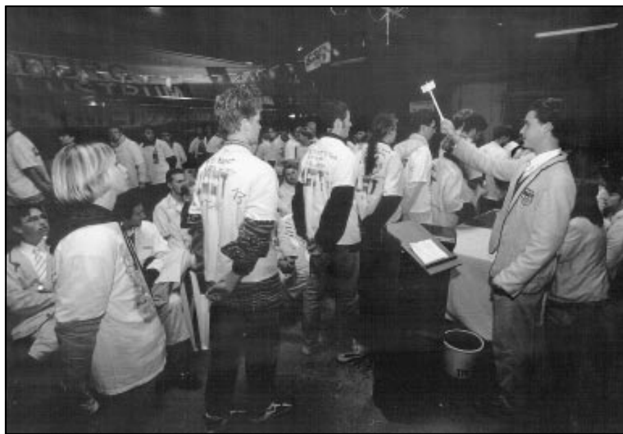
Een bestuurslid van studentenroefvereniging Theta in actie bij het dopen van aspirantleden.

dat je ervaringen opdoet die je van dienst zullen zijn in je verder loopbaan. Bestuurswerk is een zo'n ervaring. Blijkbaar was het bestuur van de TUE dezelfde mening toegedaan. Om studenten die toch een bestuursfunctie ambieerden, de helpende hand te reiken, stelde de TUE een speciale beurs in; de zogeheten bestuursbeurs.