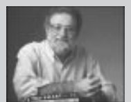
Professor Donald A. Norman, vice-president van de Apple Advanced Technology Group (ATG) van Apple Computer.

Professor Donald A. Norman is vice-president van de Apple Advanced Technology Group (ATG) van Apple Computer. In zijn vorige functie was hij professor bij het Department of Cognitive Science aan de universiteit van Californië in San Diego. Bij deze universiteit heeft hij 27 jaar gewerkt. Norman heeft gestudeerd aan het Massachusetts Institute of Technology (MIT) en de universiteit van Pennsylvanië. Na zijn emeritaat in 1993 werd hij Apple Fellow bij Apple Computer. In juli 1995 volgde zijn benoeming als vice-president van ATG. Donald Norman is een expert op het gebied van de 'menselijke' kant van technologie, met enige nadruk op de interactie tussen techniek en maatschappij. Zijn lijst van publicaties en lidmaatschappen aan nationale en universitaire commissies is lang. Hij heeft vele boeken geschreven, waaronder Models of human memory (1970), Perspectives of cognitive science (1981), Learning and memory (1982), The psychology of everyday things (1988), Things that make us smart (1993) en Defending human attributes in the age of the machine (1994). Zijn boeken zijn vele malen vertaald, onder andere in het Frans, Duits, Italiaans, Japans, Spaans, Chinees en ook Nederlands. Hij is vele malen geïnterviewd voor radio, tv en tijdschriften. Aanstaaende woensdag is hij één van de sprekers op het congres 'De Telematica Revolutie' dat in het auditorium gehouden wordt.