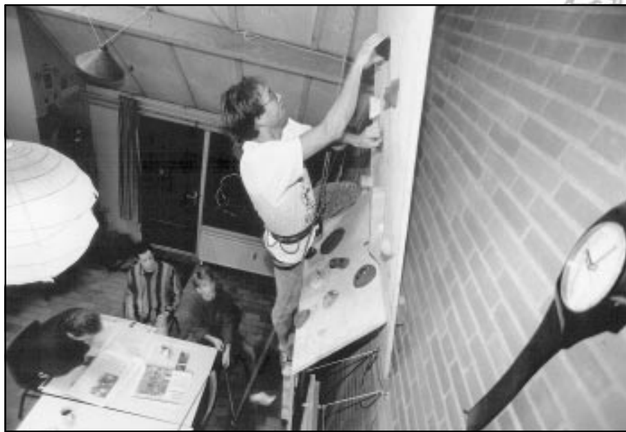
Nog net niet de Mount Everest, maar wel de hoogste berg in Woensel-West.

met een paar M10-bouten tegen de muur, vervolgens maak je nog een aantal handgrepen van hout of MDF, et voilà: une montagne à la maison.' Nou heeft hij wel geluk dat de woonkamer vrij groot is uitgevallen want niet iedereen zal een klimmuur van 4,5 meter hoog kwijt kunnen. Op de vraag wat de huisbaas van zijn initiatief vindt antwoordde hij: 'Dit is een stichtinghuis en hen heb ik alleen maar gezegd dat ik een paar gaten in de muur zou boren. Daar hadden ze geen bezwaar tegen.' Wel vraagt hij ons nog om het adres niet te vermelden, misschien is zijn huisbaas er toch niet zo blij mee?