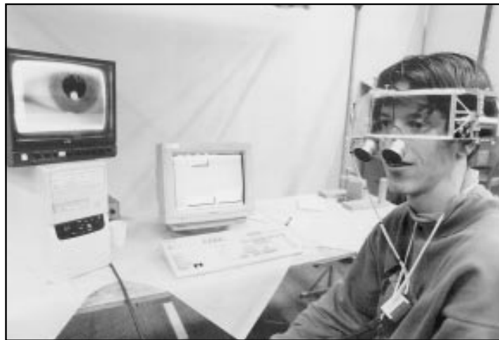
Video eye tracking: apparaat waarmee men de oogbeweging registreert, wat weer iets zegt over de werking van het evenwichtssorgaan.

Maastricht, zeer bemoedigend te noemen. Tot nu toe zijn er zo'n negenhonderd aanvragen voor informatie over de opleiding bin-