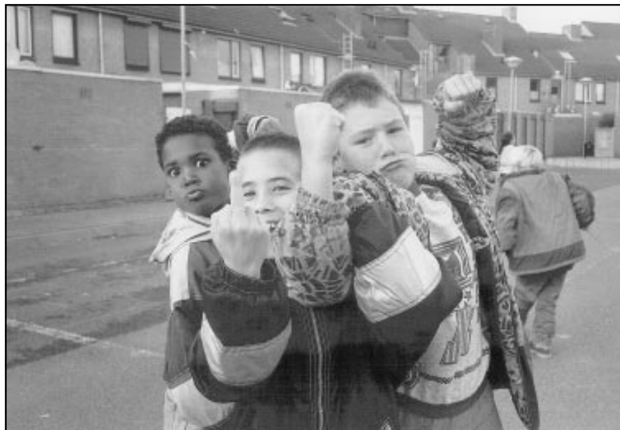
In de hal van het hoofdgebouw komt van 21 februari t/m 23 maart een tentoonstelling over 25 jaar stadsvernieuwing.

Meer informatie over het komende SG-programma en alle data en locaties zijn te vinden in het onlangs verschenen Sgrift .