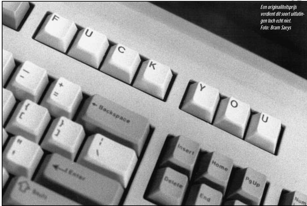
Een originaliteitsprijs verdient dit soort uillattingen toch echt niet.

door Jannigje Gerritzen & Willem van Rossum