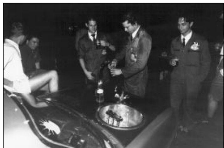
De 'bierwagen' van Elektrovereniging Thor.