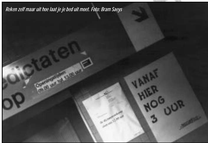
Reken zelf maar uit hoe laat je je bed uit moet.