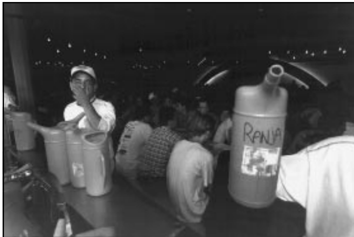
De Cantus, de noviteit van vorig jaar, werd dit jaar geprolongeed in de Mensa. Met maar liefst 1300 liter bier werden de schorre kelen vrijdag gesmeerd.