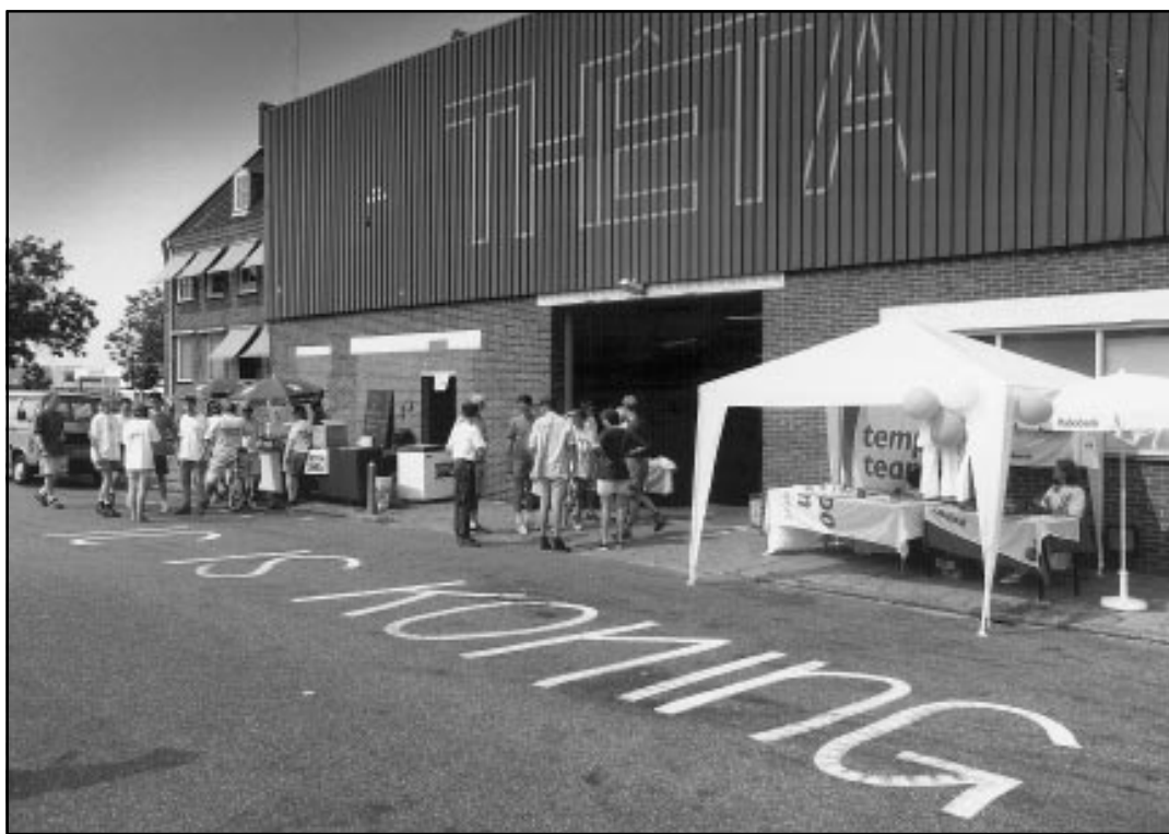
De Thêta-loods met op de voorgrond een klein deel van de gewraakte straatbeschildering.