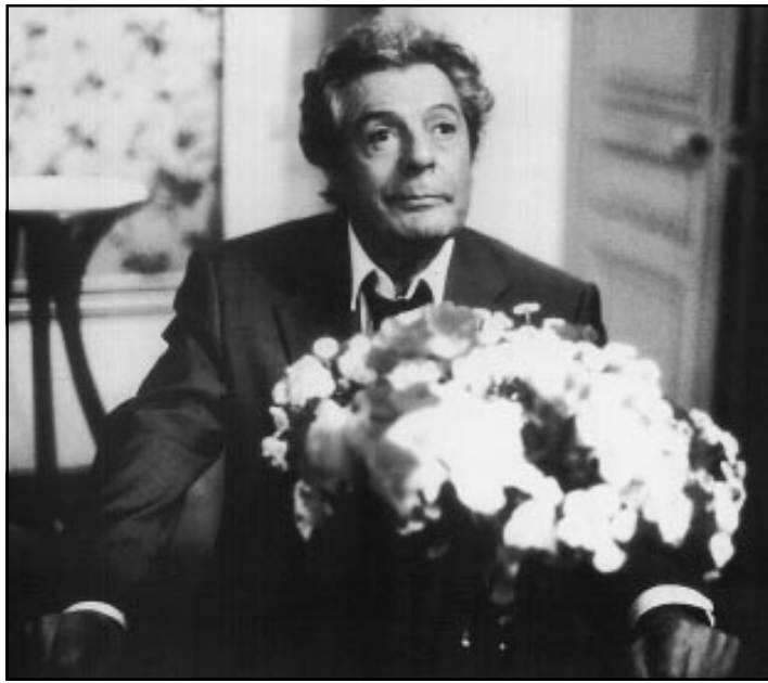
Marcello Mastroianni in één van de drie rollen in zijn laatste film 'Trois vies et une seul mort'.

Mastroianni (1924-1996) groeide op in een timmermansgezin. Hij werd industrieel tekenaar en bracht het grootste deel van de oorlog door op een zolder in Venetië, want hij was gevluht uit een Duits werkkamp. Luchino Visconti, één van de grootste (toneel)regisseurs van Italië, ontdekte hem op een avond voor studententoneel. Niet dat Mastroianni zelf studeerde: zijn vader haalde hem op zijn veertiende van school. Het werd een begin van een grote carrière, waarin hij met alle grote filmdiva's speelde: Brigit Bardot, Claudia Cardinale, Sophia Loren, Faye Dunaway en Catherine