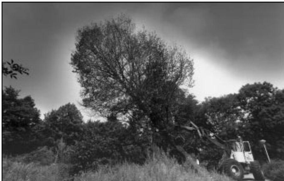
Met groot materieel worden de zieke TUE-iepen tegen de grond gewerkt.

Momenteel worden iepen in heel Nederland geteisterd door de beruchte iepziekte. De hiervoor verantwoordelijke iepenspintkever koos ook de TUE-campus tot zijn verwoestende werkterrein. Deze week worden maar liefst 28 iepen op het TUE-terrein geveld, omdat ze aangetast zijn door de larven van deze kever.