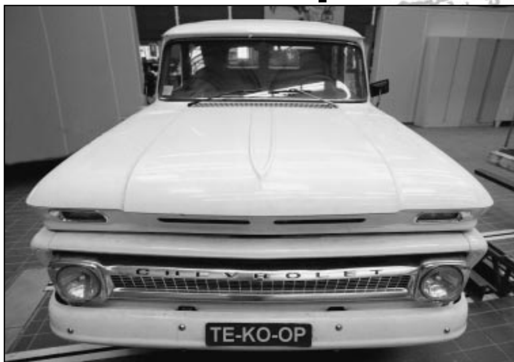
De witte Chevy C10 in volle glorie.

De natte droom van iedere eerstejaarsstudent werktuigbouwkunde wordt verkocht. Nee, het gaat hier niet om een levensgrote poster van een schaars geklede Pamela Anderson, maar om de inmiddels dertig jaar oude Chevrolet C10. Dit kunststukje van autotechniek uit vroeger jaren werd tot voor kort altijd gebruikt in de studentenpractica. Onder andere in het practicum Motortechneek werd de C10 de nodige keren aan strenge testen onderworpen. Na het grootste deel van zijn leven op de rollenbank te hebben doorgebracht zal de Chevy eindelijk ook wat kilometers kunnen gaan afleggen in de buitenlucht.