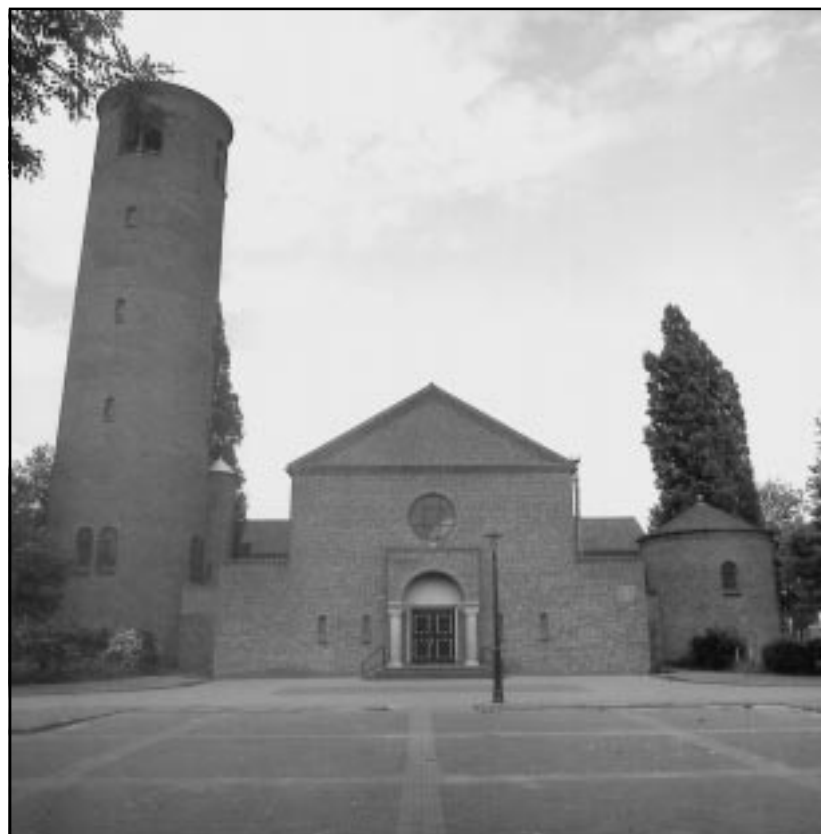
De Don Boscokerk in Eindhoven: unieke architectuur.

studentenaantallen echter begonnen terug te lopen, zag men er van af en resteerde een lege plek. Aan het eind van het project worden er drie studenten geselecteerd die als een architectenbureau gaan functioneren. In competitie met twee of drie bestaande bureaus gaan ze dan in een besloten prijsvraag wedijveren voor een nieuwe functie voor de Don Boscokerk. In oktober '98 komt er een tentoonstelling en een symposium over hergebruik, met alle betrokkenen: de gemeente, de TUE, de parochies, het wijkbestuur, het bisdom en de bewoners.