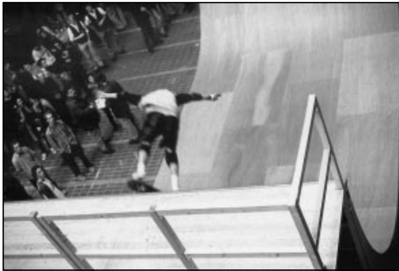
De vert in gebruik.