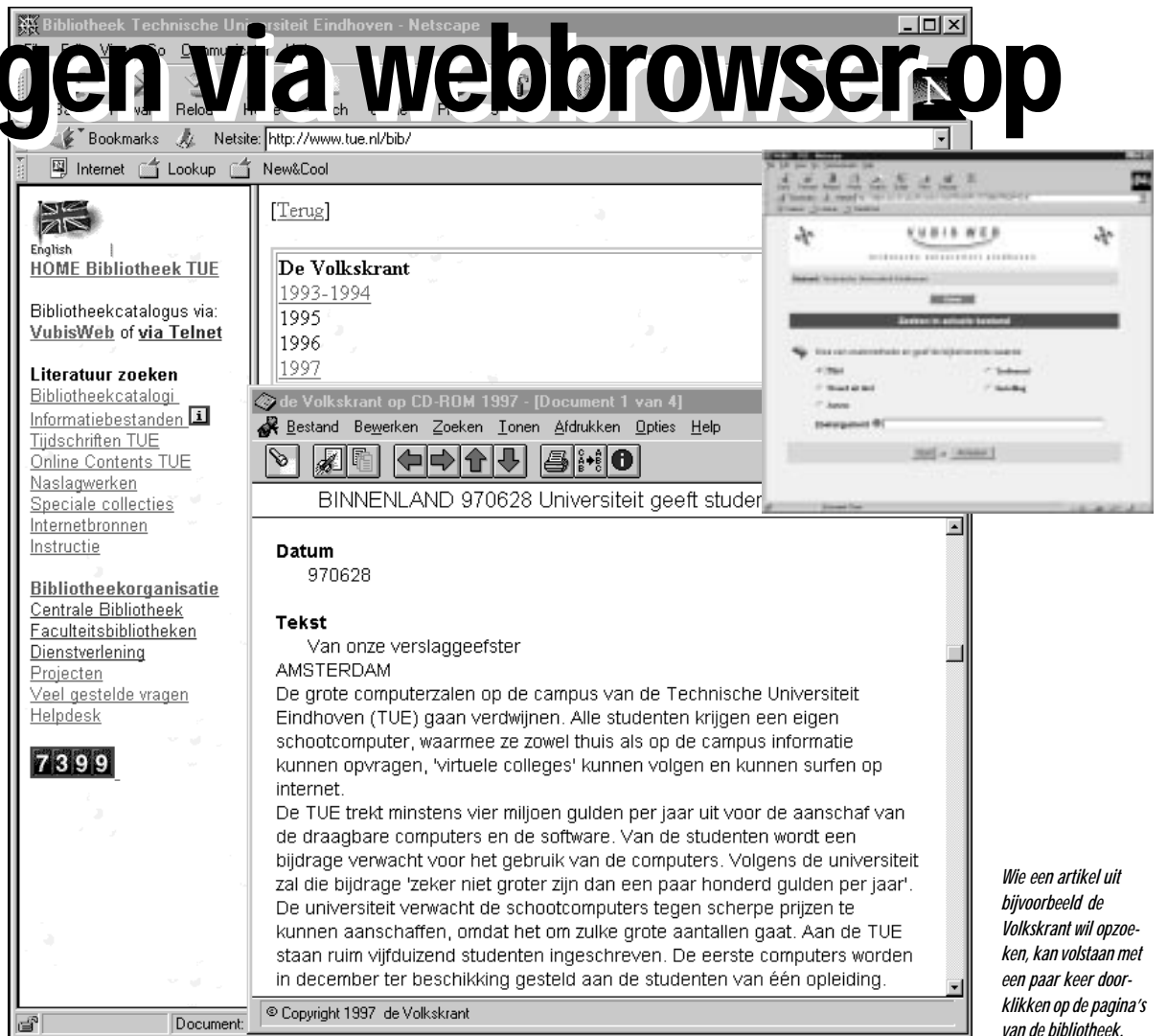
Wie een artikel uit bijvoorbeeld de Volkskrant wil opzoeken, kan volstaan met een paar keer doorklikken op de pagina's van de bibliotheek.

Dat is niet het enige nieuwe aan de bibliotheeksite. Het zoek-systeem Vubis heeft ook een HTML-jasje gekregen. Vroeger moest je, als je met een grafische interface als bijvoorbeeld Windows werkte, in een 'DOS-box' Vubis als telnet-applicatie openen; nu opent Vubis gewoon binnen Netscape. Overigens is dit deel van de bibliotheeksite nog experimenteel; je kunt bijvoorbeeld nog geen boeken reserveren via de browser-versie. Wel is Vubis via bijvoorbeeld Netscape gewoon met een DOS-venster te openen. De cd-roms kunnen volgens de informatie op de bibliotheeksite niet alleen door DOS-machines worden geraadpleegd, maar ook door UNIX-machines. Overigens kunnen alleen gebruikers binnen het TUE-domein gebruikmaken van deze faciliteiten. Wie dus een artikel uit bijvoorbeeld de Volkskrant wil opzoeken, kan volstaan met een paar keer