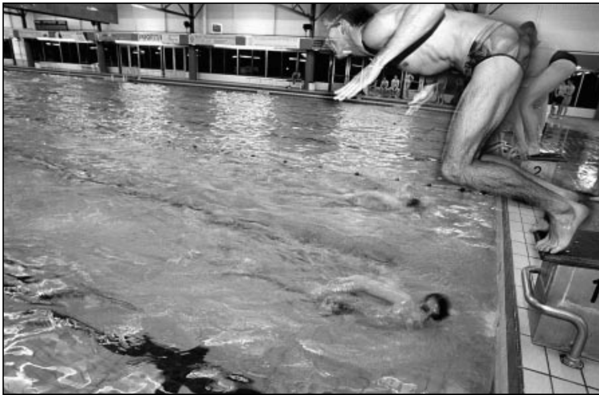
Vorige week donderdag ging de teamcompetitie van Squadra Veloce van start met een zwemestafette.

De VVD zette haar verzet het sterkst aan. Zij wilde duale trajecten in het wetenschappelijk onderwijs zelfs verbieden. Voor dat voorstel kregen de liberalen echter nauwelijks steun. Woordvoester De Vries koos daarom eieren voor haar geld en stelde voor werkend leren voorlopig alleen op experimentele basis te starten. Daarmee kreeg zij wel een meerderheid achter zich. Minister Ritzen ligt niet wakker van de beperking die de Kamer hem heeft opgelegd. Hij had de universiteiten vlak voor Kerst al uitgenodigd met proeven met voor duaal onderwijs op te zetten. Met die proeven mag hij de komende twee jaar gewoon doorgaan. De Kamer bracht overigens nog een beperking aan. Duale opleidingen mogen in het wetenschappelijk onderwijs pas na de propedeuse van start gaan. Zo wil de Kamer waarborgen dat studenten in ieder geval eerst een academische basis hebben voordat zij aan het werk gaan.