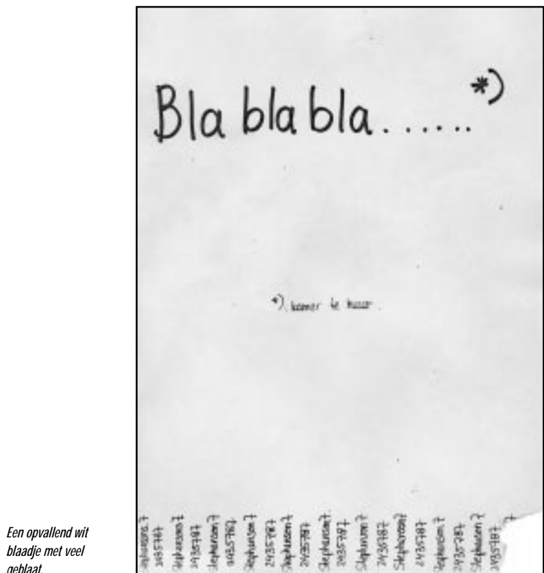
Een opvallend wit blaadje met veel geblaas.

had getooid met een benaming die verwees naar de helden van de scherm sport; de drie musketiers. Er hoefde niet lang te worden nagedacht door de mensen van Hoc Habet en een paar dagen later plofte er een 'officiële' brief in de bus bij het bestuur van Asterix afkomstig van de garde van de kardinaal. Vanwaar die naam? Iedereen die de film of het boek van de drie musketiers gezien of gelezen heeft, weet dat de aartsvijand van de drie musketiers de garde van de kardinaal is. Opgesteld in iets dat moeten lijken op oud-Nederlands, compleet met zegel en in niet mis te verstane bewoordingen, werden de zes Asterix-musketers uitgedaagd om hun nieuwbakken naam eer aan te doen. Het duel wordt uitgevochten met de wapens van Hoc Habet (degen, sabel, floret) en dus niet met spikes of speren. Op dinsdag 17 februari zal rond half tien het geluid van kletterende sabels overheersen in het sportcentrum. Misschien worden er links en rechts nog wat kroonluchters opgehangen en kan de voorlichtingsafdeling opnames voor het Video-jaaroverzicht van '98 komen maken voor een parodie op 'The Three Musketers', met in de hoofdrollen de zes musketiers van Asterix en het bestuur van Hoc Habet. Bekijk 't maar rekt op een bloederig spektakel.