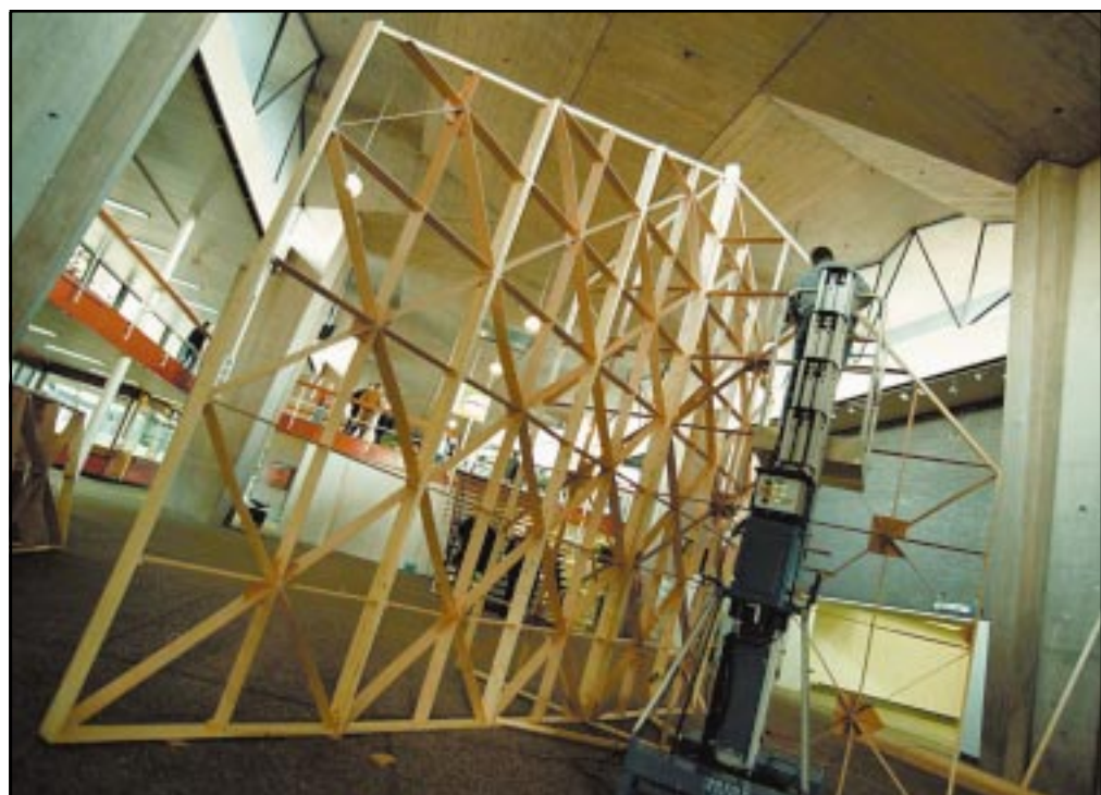
Langzaam ontvouwt zich in de hal van het hoofdgebouw de tent waar vanaf morgen de tentoonstelling 'De diepte van het oppervlak' te zien is. De expositie geeft een beeld van het werk en de systematiek van de vouwkunstenaar Paolo Barreto. De tent, een ontwerp van Barreto, is een langs drie lijnen gevouwen vierkant oppervlak. Zie ook pagina 11.