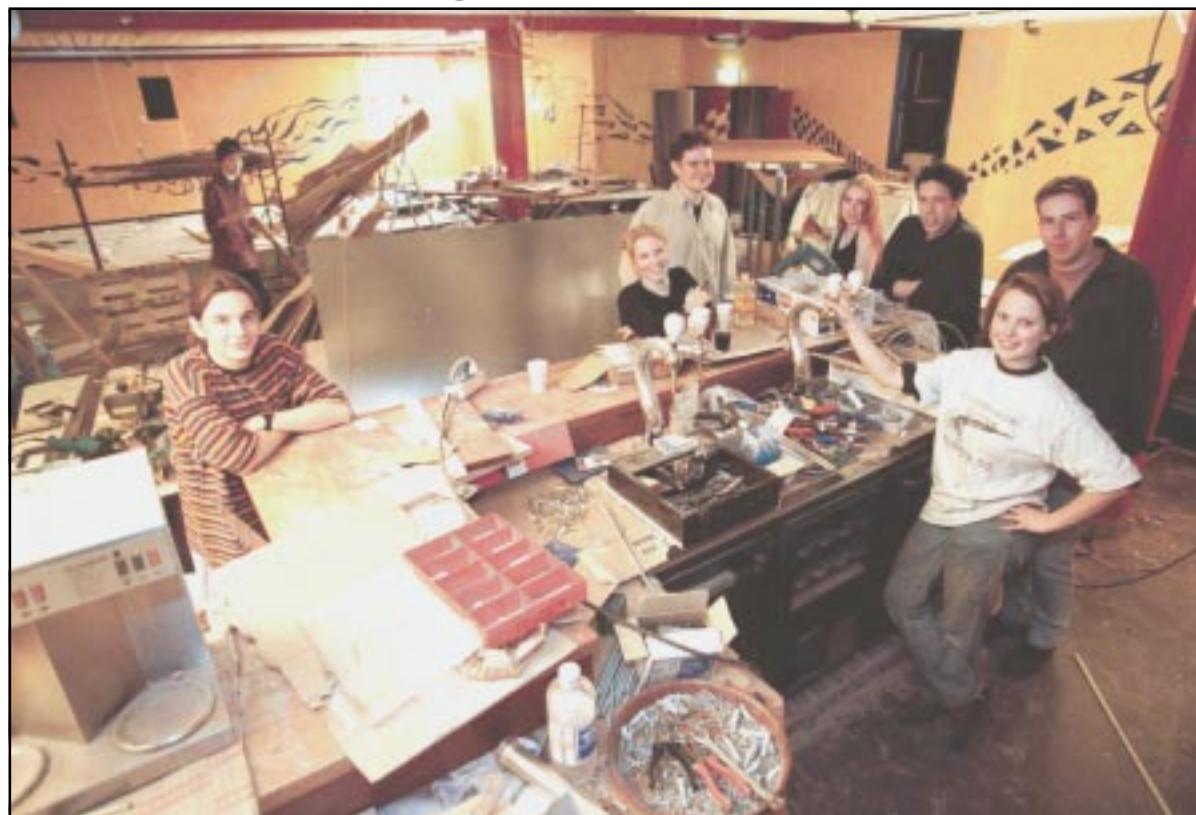
Een week voor de opening zijn medewerkers van de AOR nog hard bezig om de laatste hand te leggen aan Café Onderdruk, de nieuwe naam voor de verbouwde benedenbar. Op zaterdag 28 februari opent de nieuwe bar met een optreden van Skik en een feest. Voor meer informatie over de verbouwing en de nieuwe ruimte zie pagina 3.

intentie de vacature te vervullen, nog voor de zomer, zo bleek tijdens de raadsvergadering. Het is echter opvallend dat een CvB, dat zich terecht mag beroemen op zoveel besluitvaardigheid, ook waar het het benoemingenbeleid betreft, opeens zo talmend en moeizaam opereert als het aankomt op het aanvullen van de eigen gelederen. Angst voor een gebrek aan besluitvaardigheid kan het niet zijn: bij een aantal van drie zullen de stemmen immers nooit staken. Kennelijk is het aanstellen van een derde functionaris dus een moeilijke zaak. Het verleden heeft trouwens wel vaker aangetoond dat een triumviraat instabiel van karakter is. Uiteindelijk kan dat inderdaad tot het keizerschap leiden.