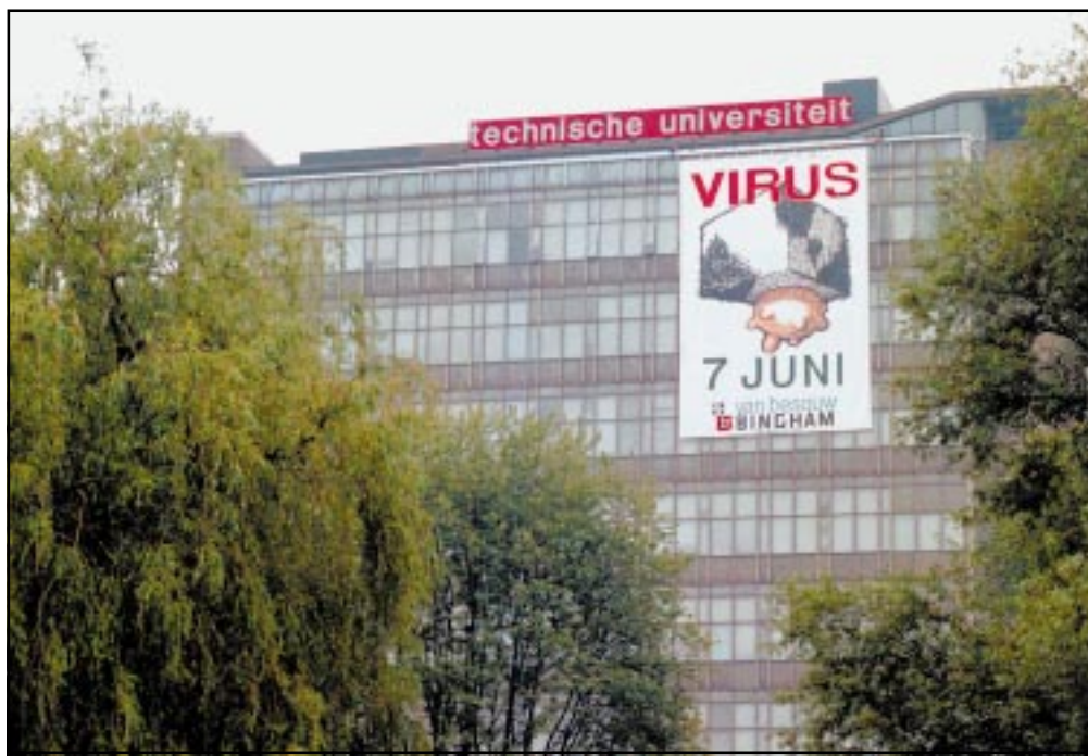
Deze week werd aan het oude gebouw van Scheikundige Technologie en 'klein' visitekaartje gehangen om mensen te attenderen op het aanstaande Virusfestival.

Het festival begint direct al bij de ingang bij de loopbrug van het auditorium. Dat is aangekleed door studenten van de Design Academy, die ook de fietsenstalling onder handen nemen. Daarna begeleiden twee travestieten de bezoekers naar het terrein, waar ze worden losgelaten op het festivalterrein met tien podia. In het auditorium zijn vijf locaties. In de Filmzalen 4 en 5, ook wel bekend als de collegezalen 4 en 5, draaien onder meer 'Kids' (over de seksuele escapades van een stel New-Yorkse jongeren), het heftige 'Once were Warriors', het eens spraakmakende 'Last Tango in Paris' met Marlon Brando en Maria Schneider en 'Hana-bi', de nieuwste van de Japanse sterregisseur, tv-presentator en