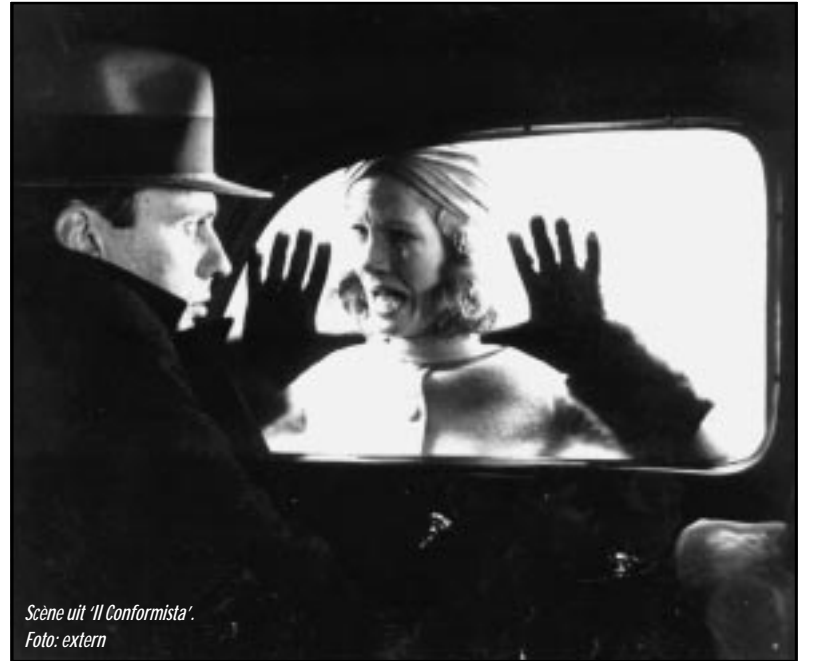
Scène uit 'Il Conformista'.

en Donald Sutherland. Andermaal haalde Justitie een wetje van Mussolini van stal omdat één persoon zich door de 'obscentiteiten' (de naaktscènes dus) beledigd voelde. Dus emigreerde Bertolucci, hij kon niet werken in een land waar de hand van Mussolini nog zo aanwezig was. Bertolucci, die in therapie was en de divan een goede voorbereiding vond op het filmmaken, combineerde in 'Il Conformista' zijn freudiaanse en politieke opvattingen. Marcello wil het liefst 'zo normaal mogelijk zijn' en trouwen met de oerbürgerlijke Giulia. Hij wordt gedreven door zijn schuldgevoel over zijn homoseksuele gevoelens. Hierdoor wil hij zich onderwerpen aan een autoriteit, waardoor de angst voor zijn eigen persoonlijkheid nog verergert. Daarom zoekt hij een vaderfiguur en vindt deze in de oude filosofiedocent en anti-fascist Quadri, maar nog meer in het fascisme, dat een nog sterkere vaderfiguur symboliseert. Marcello moet kiezen. 'Il Conformista' is met zijn speciale encensering, gewaagde