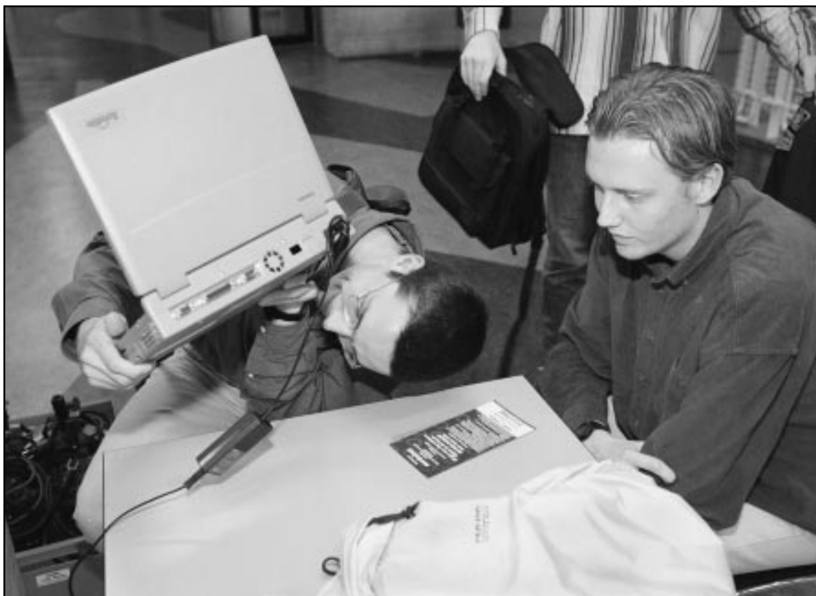
Een eerstejaars onderwerpt zijn zojuist verworven notebook aan een grondig onderzoek.