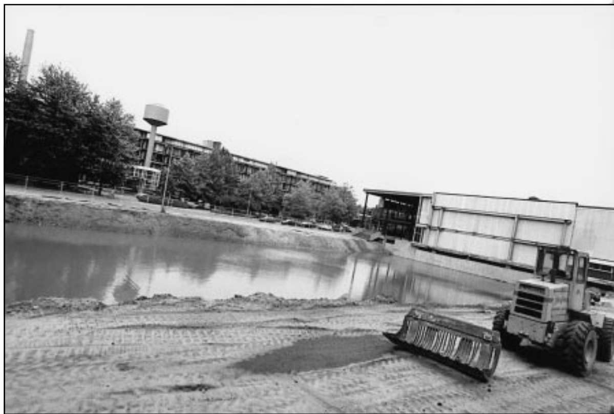
Nog enige afwerking lijkt op zijn plaats.

W&S. Dat er links en rechts nog wat afgewerkt moet worden, mag voor de echte waterrat geen belemmering zijn.