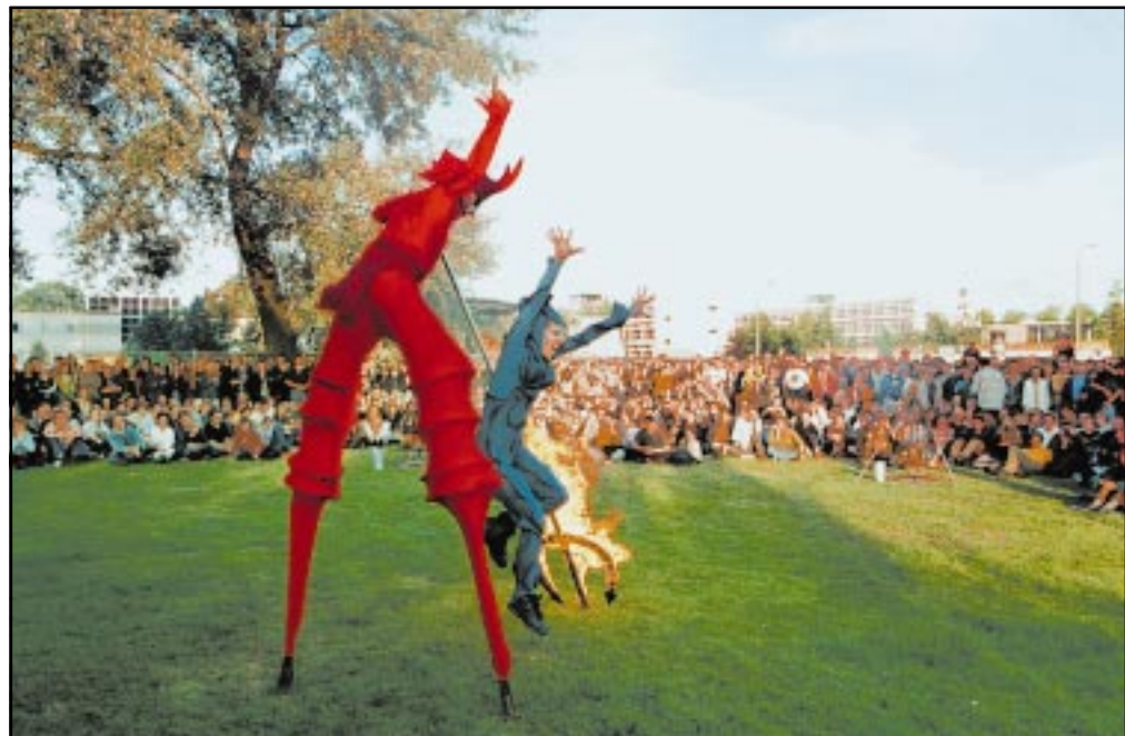
Zondag vond op het TUE-terrein Virus '98 plaats. De weergoden waren de organisatoren op het laatste moment toch gunstig gezind, wat zorgde voor een toestroom van zo'n vijfduizend betalende bezoekers. Op bijgaande foto is het spectaculaire optreden van de groep Close Act te zien. Voor meer informatie over dit cultuurfestival en meer plaatjes: zie pagina 5.